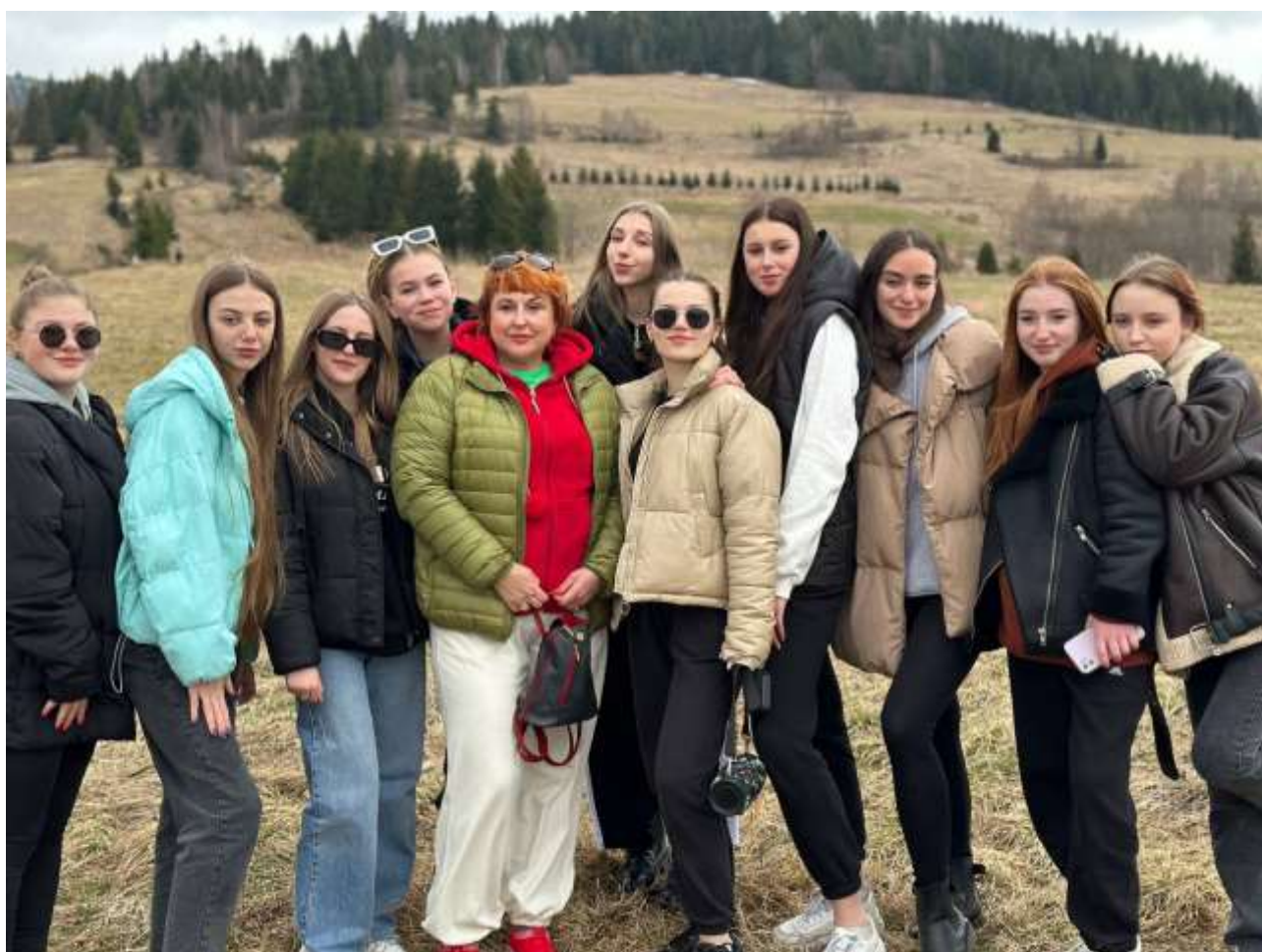
Група ІІ МСфЗ. Виховний момент: «Навчаємось і відпочиваємо разом»