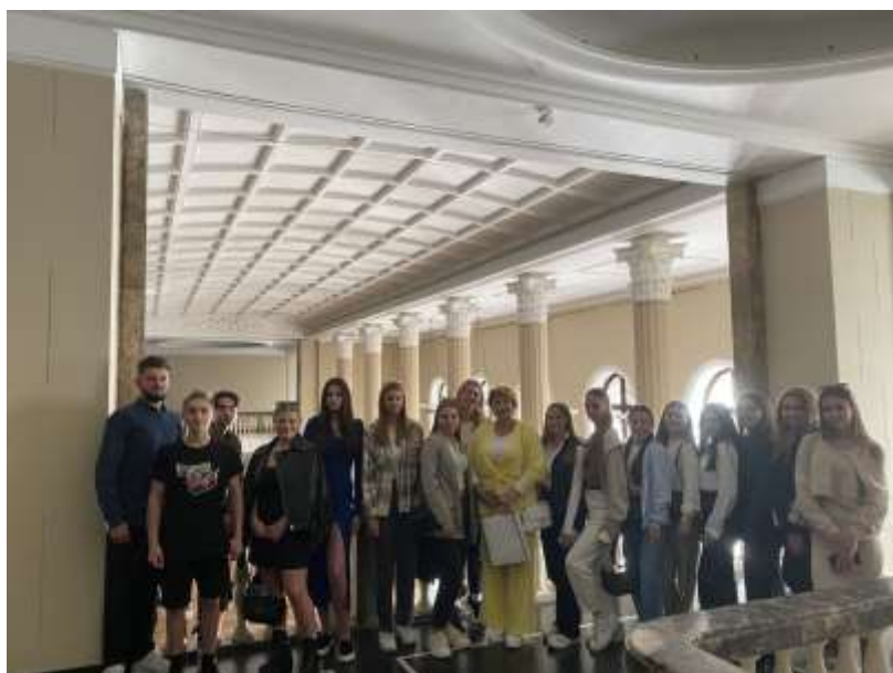
Участь у загальноакадемічному заході до 250-річчя Львівської медичної академії імені Андрея Крупинського. Перегляд вистави в театрі ім. М.Заньковецької «Тільки у Львові» жовтень 2023р.