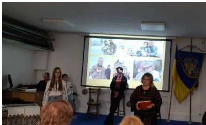
Участь групи у виховному заході на відділенні 1. Жовтень 2023р.