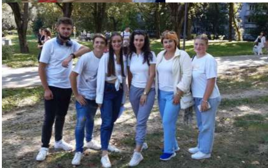
Участь членів групи ІІ мсфЗ у благодійній акції «Допомога ЗСУ» вересень2023р.