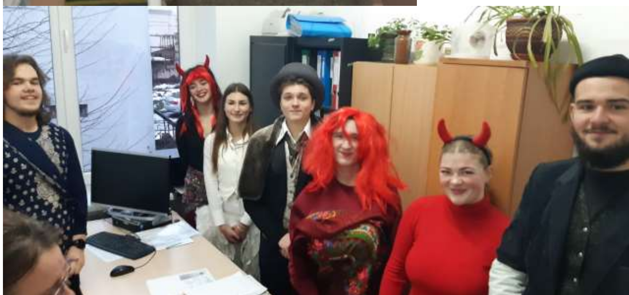
II МСФЗ учасники вітального Вертепу для викладачів і студентів грудень 2023р.