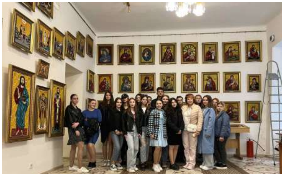
Експерсія в музей вишитих ікон отця Блажейовського