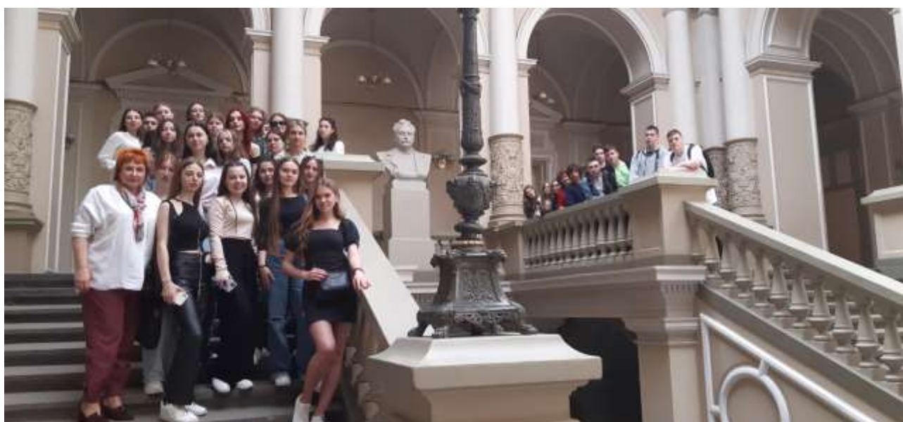
Знайомство з університетською історією. Тема бесіди: «Іван Франко – геній України в історії культури». Березень 2024 р.