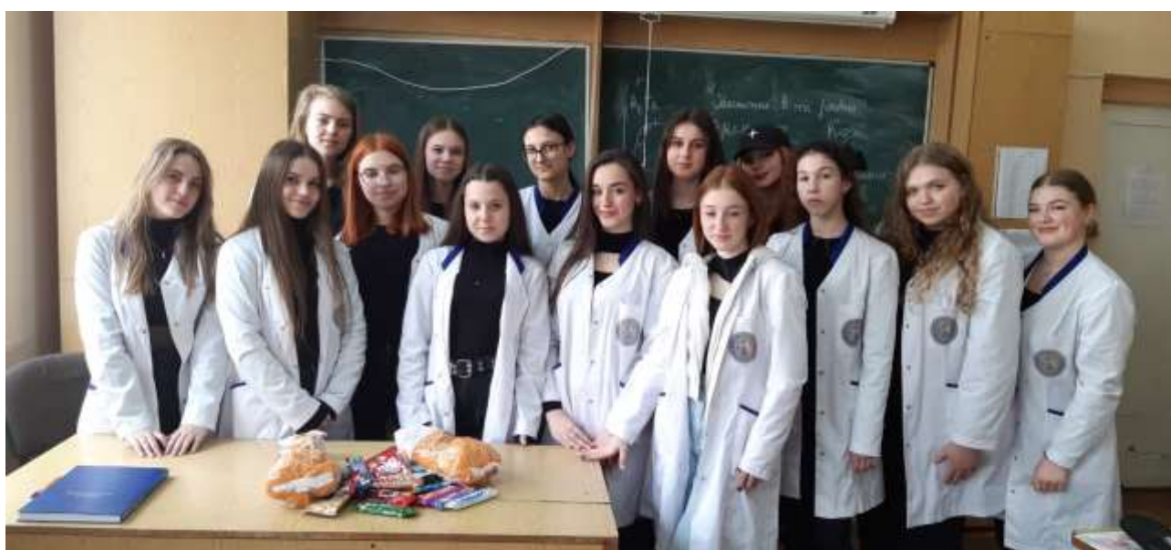
Виховний момент у групі ІІ мсфЗ «Маленька допомога нашим захисникам. Вересень 2023р.