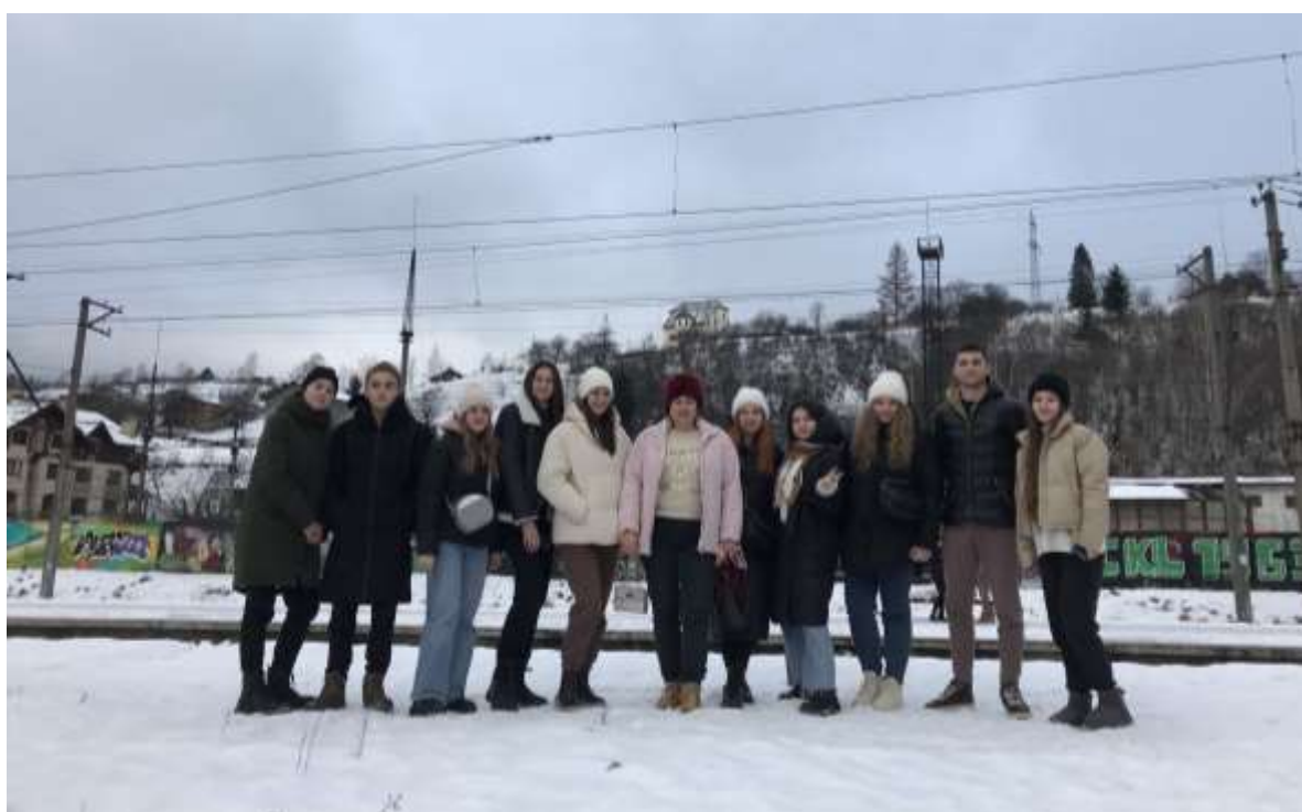
Екскурсійна пізнавальна подорож групи ІІмсф3 і 4 в українські Карпати. Тема: «Славсько давнє селище історії епохи неоліту». Грудень 2023 р.