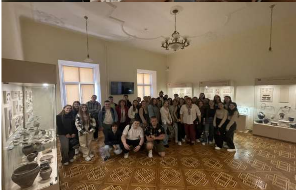
Експерсія в музей археології : «Витоки української культури» березень 2024р.