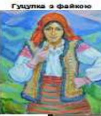
Гуцулка з фаякою