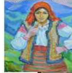
Гуцулка з фаякою