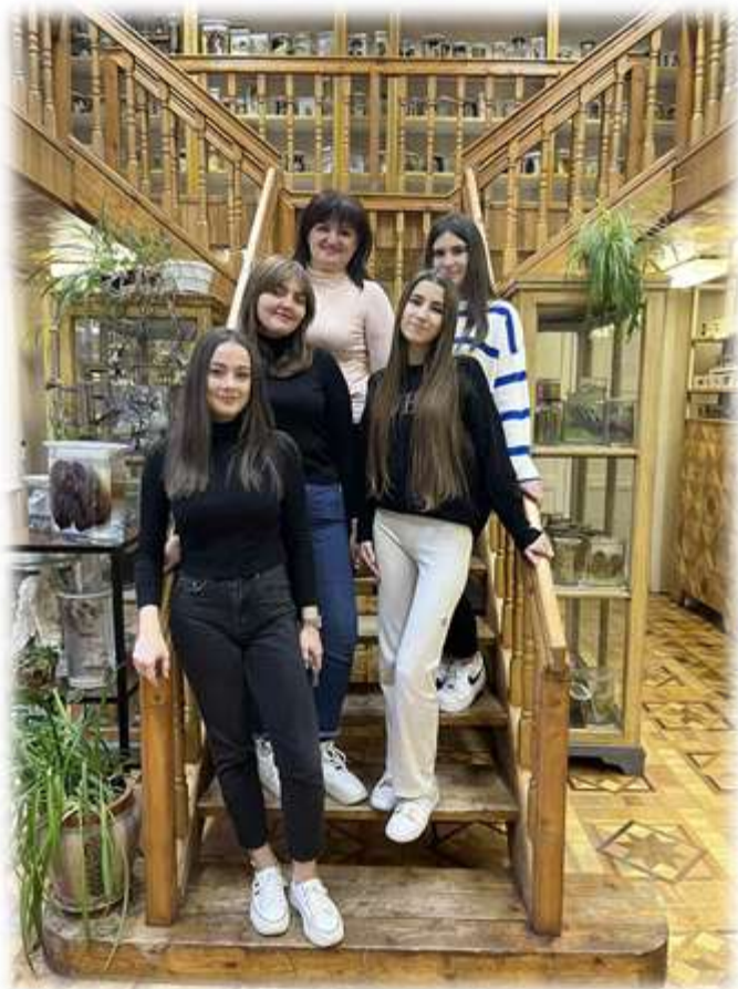
Музей хвороб людини 19.10.23

Академічна доброчесність базується на згоді усіх учасників академічного процесу дотримуватися правил та виконувати покладені на них обов'язки. На жаль, непорозуміння між викладачами та здобувачами вищої освіти часто призводять до взаємної неприязні. Доброчесність є необхідною й важливою складовою будь-якого істинного досвіду освіти – доброчесність з боку як викладача, так і здобувача вищої освіти