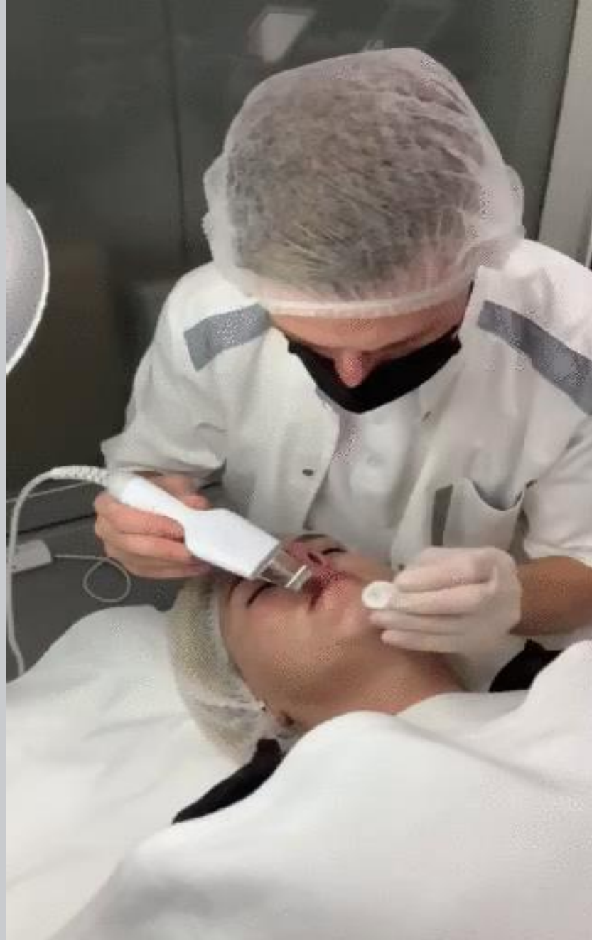
Апаратна чистка обличчя скрабером